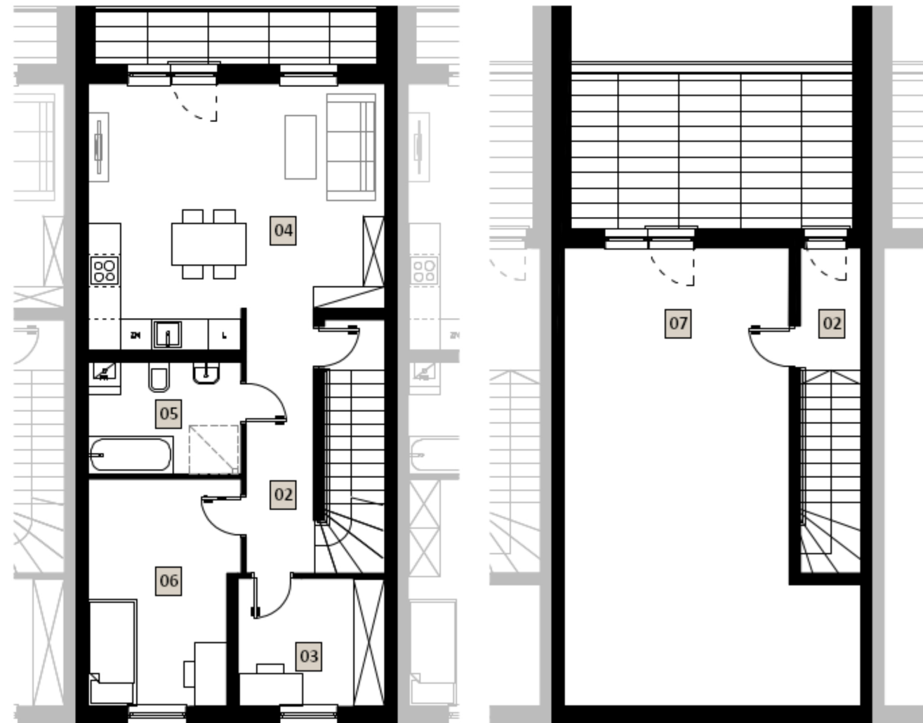
KONDYGNACJA 2 (PIĘTRO)