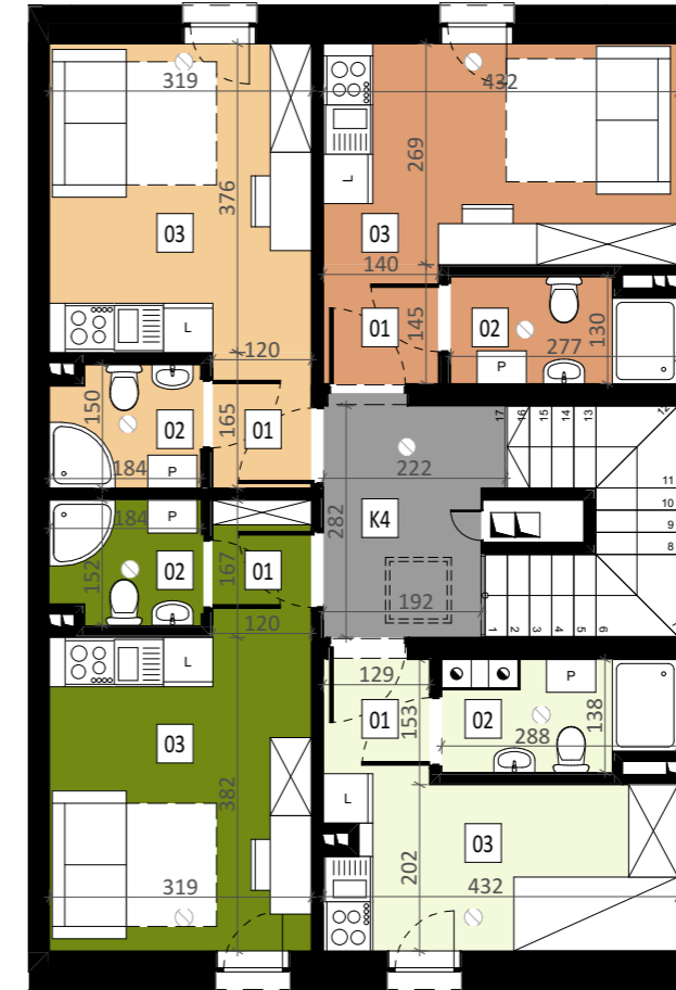
KONDYGNACJA 3 (SKALA 1:100):