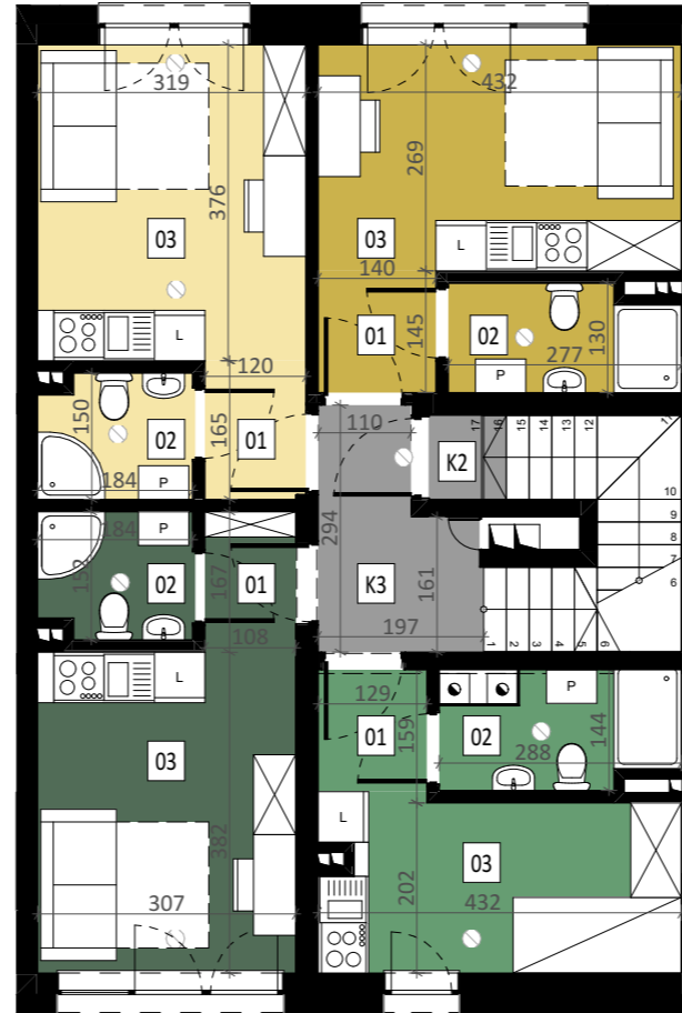
KONDYGNACJA 2 (SKALA 1:100):